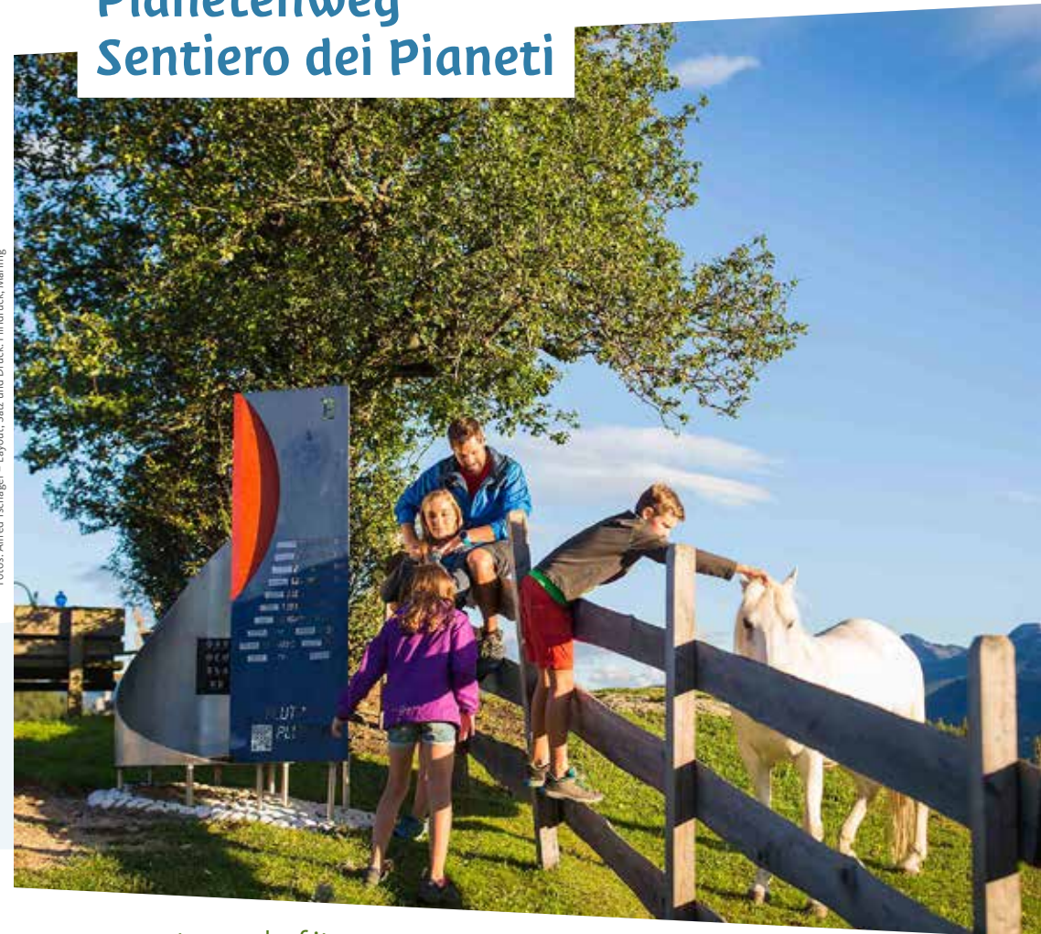
Layout, Satz und Druck: Filigrindruck, Marling

www.sternendorf.it www.astrovillaggio.it