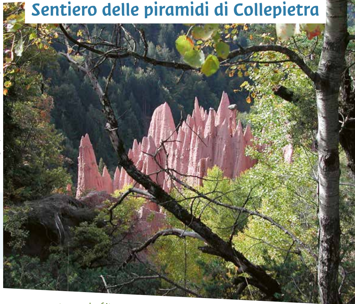
Fotos: Alfred Tschager – Layout, Satz und Druck: Filindruck, Marling

www.sternendorf.it www.astrovillaggio.it